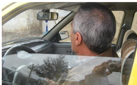
تصویر گزینه ۸