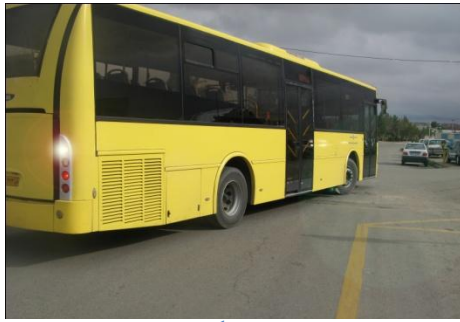
تصویر گزینه ۴

گردش ها ممکن است انتهای آن با وسیله ی در حال عبور برخورد کند، پس فاصله خود را حفظ کنید. -۴- باز هم با توجه به اینکه طول این گونه وسایل زیاد است چنانچه دیدید اتوبوس راهنما می زند ولی مسیر خود را مقداری بلعکس تغییر می دهد، بدانید که در حال دور گرفتن بوده تا بتواند به راحتی داخل مسیر شود، پس به آن نزدیک نشوید چرا که در زمان گردش دیگر در دید آینه آن قرار ندارید.