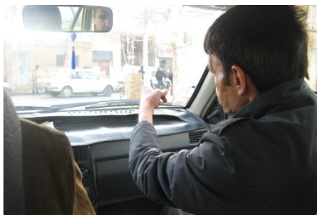
تصویر گزینه ۶