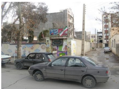
گزینه ج - مورد غلط

ب) بچه‌ها تک تک و پراکنده وارد دبستان می‌شوند اما هنگام تعطیل شدن و به صدا درآمدن زنگ دبستان مانند سیلی عظیم از کلاس‌ها خارج می‌شوند که این امر کنترل را از دست مسئولان خارج کرده و باعث سردرگمی والدین می‌شود؛ همچنین باعث هجوم و همه‌پچه‌ها برای سوار شدن به اتومبیل‌ها خواهد شد. برای حل این مشکل می‌توان راهکاری پیشنهاد کرد؛ مسئولان دبستان با هماهنگی والدین می‌توانند در یک ساعت و دقیقه مشخص و برنامه‌ریزی شده، این مشکل را حل کنند. مثلاً با زنگ اول در ساعت ۱۲:۲۵ کلاس‌های ششم، پنجم و چهارم و با زنگ دوم در ساعت ۱۲:۴۰ کلاس‌های سوم، دوم و اول (به علت آسیب‌پذیری بیشتر) تعطیل و از دبستان خارج شوند و بچه‌هایی که با سرویس به منزلشان می‌روند در حیاط دبستان جمع شده، با آمدن سرویس‌هایشان از دبستان خارج و راهی خانه‌هایشان شوند.