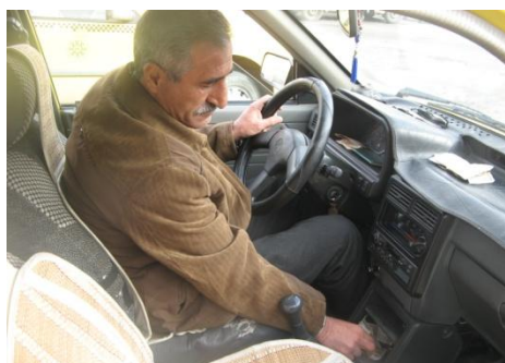
تصویر گزینه ۴