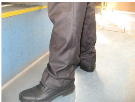
تصویر گزینه ۳

یکی دیگر از وسایط نقلیه در جابجایی مسافر، اتوبوس های عمومی درون شهری است که نیاز به رعایت اصولی دارد که باید به آن توجه کرد.