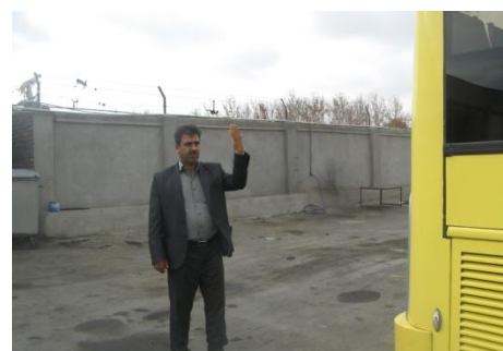
تصویر گزینه ۸