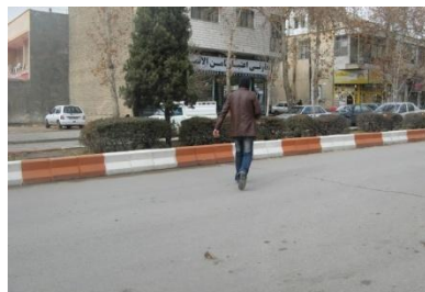
گزینه ب - روش غلط

برای عبور از عرض خیابان یا بلوار باید از خطوط عابر پیاده یا پلهای عابر یا زیرگذرهای مخصوص عابر استفاده کرد اما اگر شرایط مهیا نبود، می توان به روشهای ذیل عمل نمود: