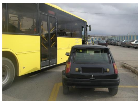
تصویر گزینه ۲