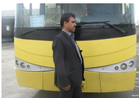
تصویر گزینه ۶