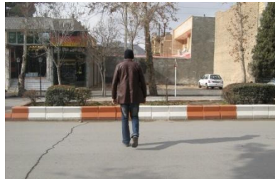
گزینه ب - روش صحیح

یکی از رفتارها، رفتار کودکان در خیابان و بازار یا بحث ترافیک، زمان تعطیلی مدارس و... است و اینکه چگونه باید رفتار کرد تا جگرگوشه هایمان در امان باشند.