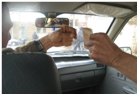
تصویر گزینه ۳