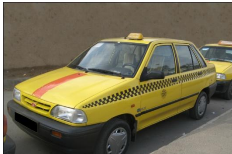
تصویر گزینه ۲

یکی دیگر از وسایط در حوزه نقل و انتقال مسافر ، وسیله ای است به نام تاکسی و همچنین دیگر وسایطی که این وظیفه را به عهده دارند.